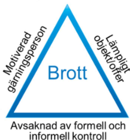
Figur 1. Brotstriangeln i dess grundform.

Enligt brotstriangeln måste tre huvudsakliga förutsättningar vara uppfyllda för att ett brott ska kunna uppstå: en motiverad gärningsperson, ett lämpligt objekt eller offer för brottet och avsaknad av formell och informell kontroll, t.ex. låg risk att bli upptäckt eller svaga sociala band. Åtgärder ska därför riktas mot en eller flera av dessa förutsättningar, eftersom sannolikheten för att brott ska begås minskar om någon av förutsättningarna saknas. Förebyggande åtgärder kan vara att t.ex. minska motivationen hos en person att begå brott, begränsa tillgängligheten till eller stärka skyddet av lämpliga brottsobjekt eller brottsoffer eller stärka den formella och informella kontrollen, d.v.s. öka upptäcktsrisken eller stärka andra faktorer som ökar den informella kontrollen.