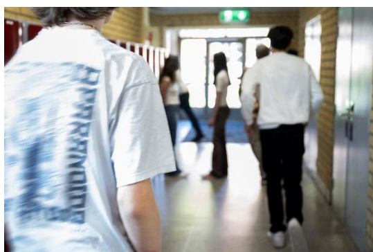
Bilden är arrangerad.

Det är mycket vanligt att barn och ungdomar delar bilder och filmer med varandra, via digitala plattformar som Snapchat och Tiktok eller på så kallade exposekonton (via länken nedan hittar du en film som beskriver vad exposekonton är).