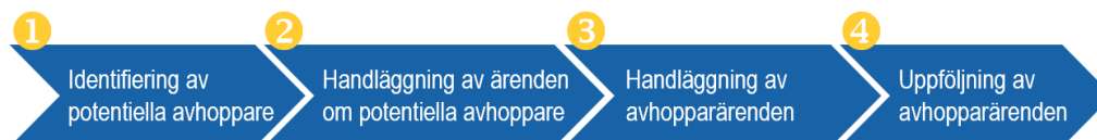
Bild 1. Modell över Polismyndighetens process i fyra steg för avhopparverksamhet.