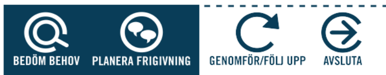
Bild 2: Modell över Kriminalvårdens inslussningsmodell

För fängelsedömda är övergången mellan anstalt och frihet omvittnat svår, varför Kriminalvården sedan ett antal år utvecklat den så kallade inslussningsmodellen. 13 Arbetet syftar till tidig och samordnad frigivningsplanering för individer med hög återfallsrisk och med många kriminalitetsdrivande behov. I den målgruppen bedöms även avhoppare ingå. Implementeringen av inslussmodellen eller liknande samverkansformer har därför varit ett uppdrag i verksamhetsplanen för Kriminalvårdens regioner, i syfte att förbättra förutsättningarna för den externa samverkan i klientärenden med kommunernas socialtjänster, Polismyndigheten, Arbetsförmedlingen med flera. Enligt inhämtade uppgifter i december 2023, har Kriminalvården en strukturerad samverkan med ett 80-tal kommuner via inslussningsmodellen eller likartade strukturer så som Trefas, Gruppsvåldsintervention (GVI), Örebrogruppen med mera.